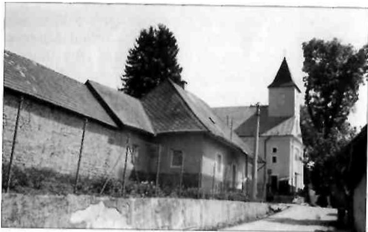
Stará budova fary

Terajšia murovaná fara bola postavená na miernom svahu po ľavej strane kostola v roku 1806. Teda stavala sa spolu s kostolom.