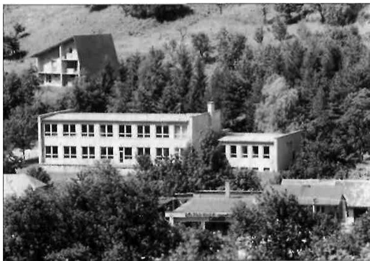
Budova novej školy z roku 1967

Dolná škola sa zachovala dodnes pri obecnom úrade. Hornú školu, ktorá stála za cestou nad ňou, roku 1987 zbúrali a na jej mieste postavili domov dôchodcov.