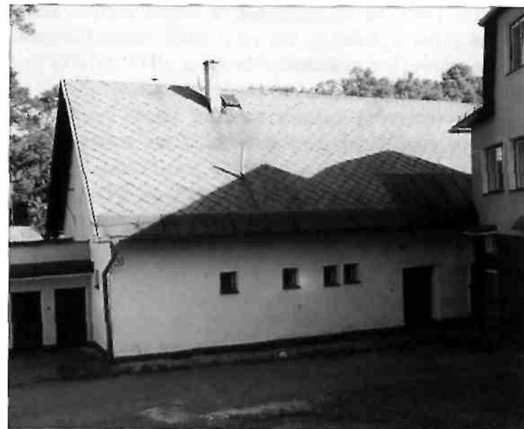
Dolná Škola z roku 1900

Roku 1824 postavili v obci kamennú budovu školy s jednou učebňou (Horná škola). V roku 1897 mala 166 žiakov. Škola až do roku 1900 bola jednotriedna. Pre vzrast počtu žiakov roku 1900 postavili druhú budovu školy z kameňa (Dolná škola). V nej bola jedna učebňa a byt pre organistu-učiteľa (izba, kuchyňa, komora). Zubáčania si s veľkými obetami udržiavali školu. Prekážkou vzdelávania detí bola aj veľká vzdialenosť jednotlivých osád od školy. Preto v Zubáku okolo roku 1880 bolo 50 percent analfabetov, čiže ľudí, čo nevedeli čítať a písať. Začiatkom 20. storočia počet analfabetov klesol na 20 percent, medzi ktorými bolo najviac kopaničiarov.