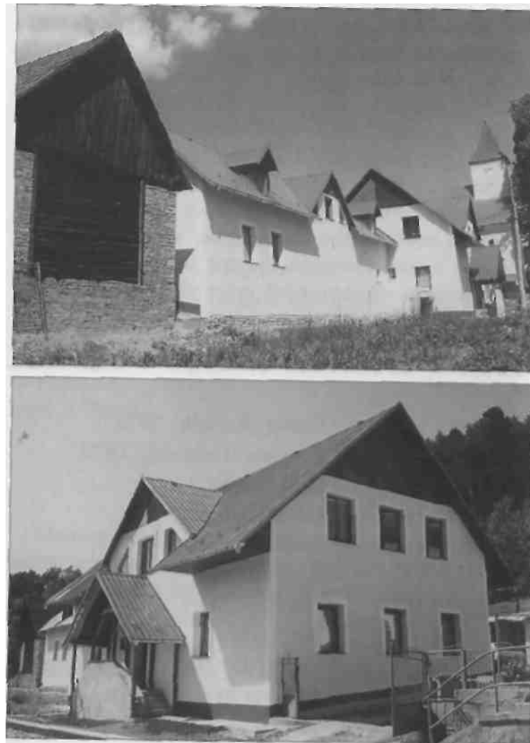
Dva pohľady na rekonštruovanú budovu fary

Rekonštrukciou farských hospodárskych budov sa vybudovalo charitatívne centrum, ktoré bude využívané